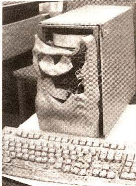
En casa de herrero cuchillo de palo, los virus nos dejaron fuera de circulación

En casa de herrero cuchillo de palo, reza el dicho y es que resulta que toda la semana del 3 de abril el Diario Avance fue desconectado de la red por el personal de Cantv.net debido a la supuesta presencia de un virus, lo que hizo prácticamente imposible la búsqueda de información actualizada sobre todo lo que ocurre en el mundo de la red. El siguiente fin de semana fue el pasado sábado santo, cuando no circulamos por razones obvias.